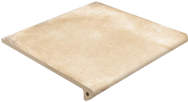
Ступень клинкерная фронтальная Exagres Alhamar Paja Peldano Fiorentino 33x33