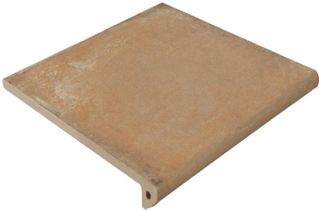
Ступень клинкерная фронтальная Exagres Alhamar Salmon Peldano Fiorentino 33x33