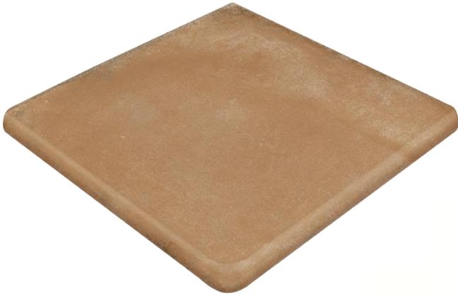
Ступень клинкерная угловая Exagres Alhamar Salmon Cartabon Fiorentino 33x33