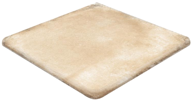
Ступень клинкерная угловая Exagres Alhamar Paja Cartabon Fiorentino 33x33