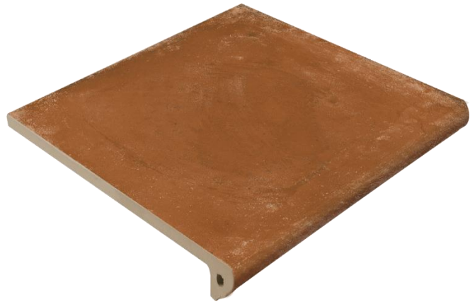
Ступень клинкерная фронтальная Exagres Alhamar Rojo Peldano Fiorentino 33x33