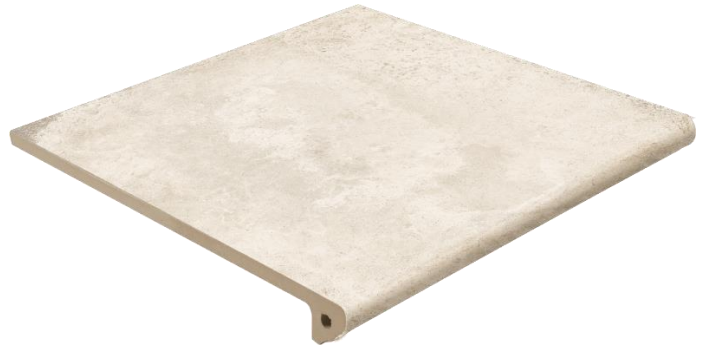
Ступень клинкерная фронтальная Exagres Alhamar Blanco Peldano Fiorentino 33x33