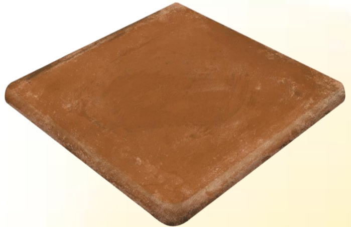
Ступень клинкерная угловая Exagres Alhamar Rojo Cartabon Fiorentino 33x33