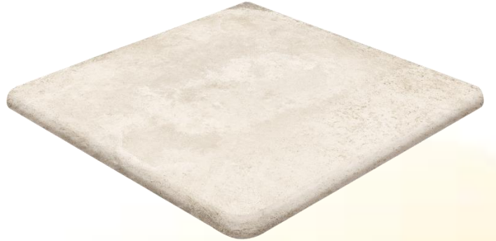
Ступень клинкерная угловая Exagres Alhamar Blanco Cartabon Fiorentino 33x33