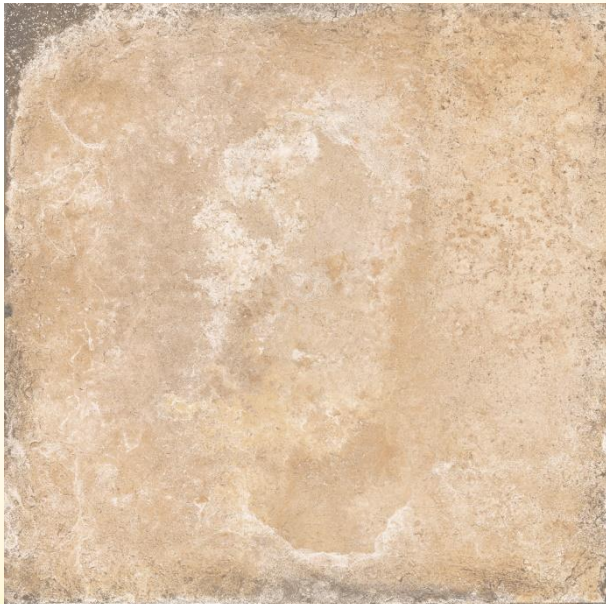
Клинкер Exagres Alhamar Salmon 33x33